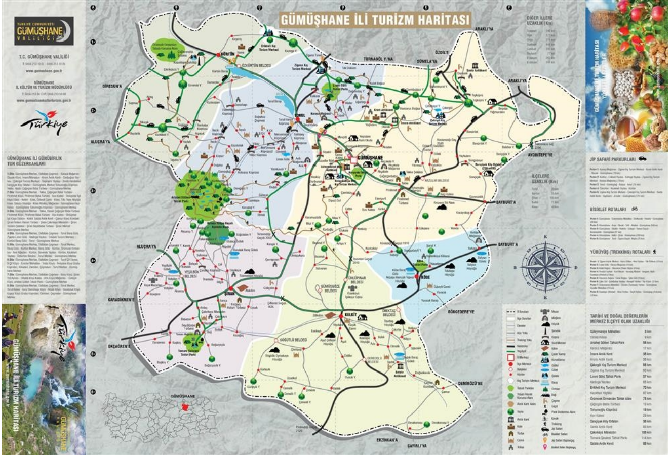
Şekil 2. Gümüşhane ili turizm haritası

Çalışma alanı olarak belirlenen Gümüşhane'de yapılan araştırmalar sonucunda, başta yayla ve festival turizmi olmak üzere doğa yürüyüşü (Trekking), kış, mağara, av, hava sporları, sportif olta balıkçılığı, akarsu, yelken, bisiklet, kamp karavan turizm çeşitleri ile atlı doğa yürüyüşleri, yaban hayatı (fauna) gözlemciliği, rafting ve foto safari gibi doğa turizmi etkinlikleri mevcuttur.