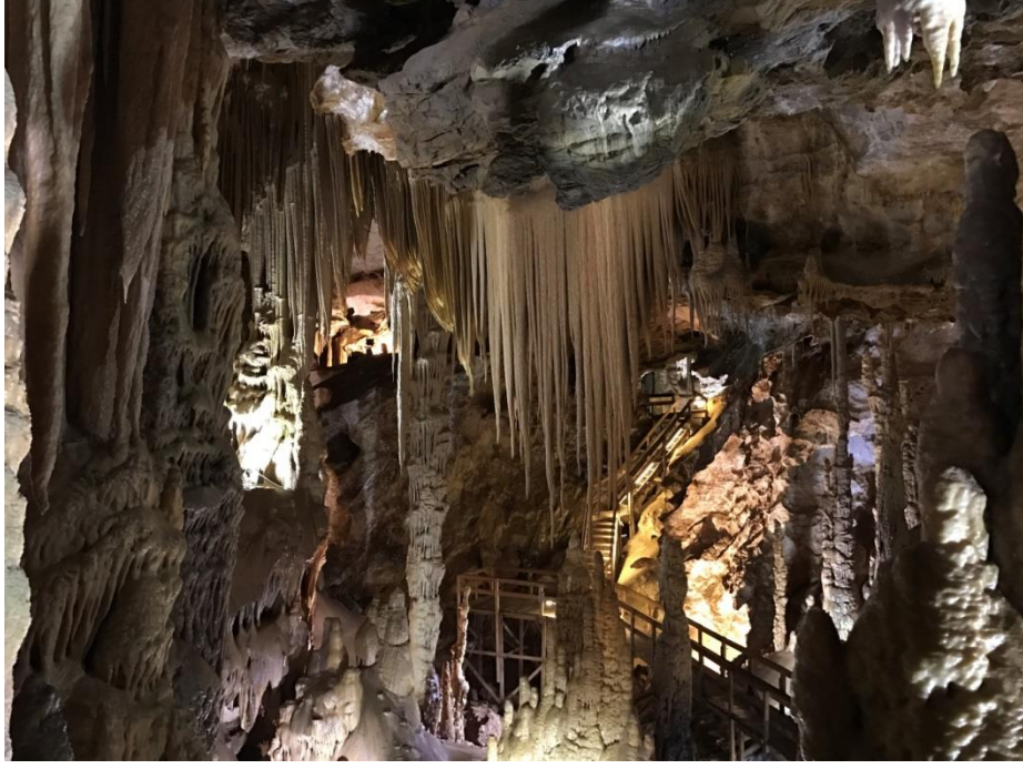
Şekil 2. Karaca mağarasında farklı boyut, renk ve özellikle çok sayıda damlataşı gelişmiştir.