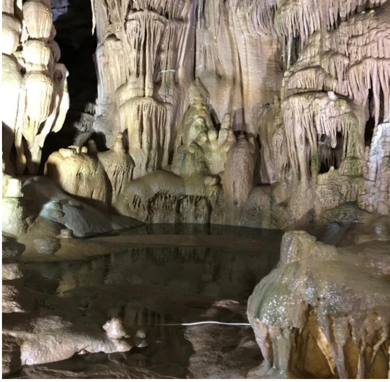
Şekil 4. Karaca Mağarası'nda çok sayıda traverten havuzu da yer almaktadır.