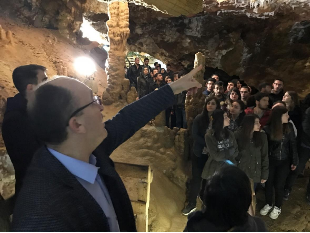
Şekil 5. Karaca Mağarası, açılışından bu yana Gümüşhane'ye gelen turistlerin en çok rağbet ettikleri çekiciliklerden biri olmuştur.