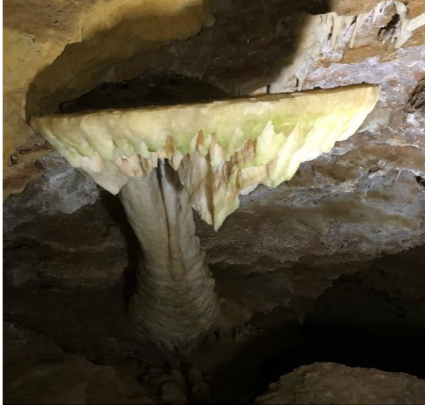
Şekil 3. Karaca Mağara'sına yer alan ve en çok ilgi çeken damlataşlarından biri olan "gelin duvağı".