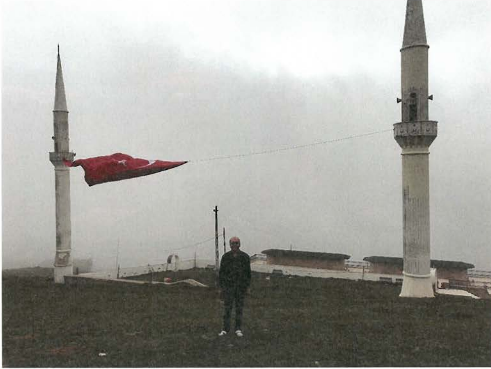
Foto 4. Kadirga Yaylası'nda yüzyıllardır Cuma namazlarının kılındığı üstü açık cami.

İnceleme alanındaki yaylalarda fonksiyonel değişim gerçekleşmekle birlikte halen hayvancılık da yapılmaya devam etmektedir. Yaylalarda üretilen yerel ürünler bir taraftan doğrudan ziyaretçilere satılabildiği gibi, daha çok yakın çevredeki büyük yerleşim merkezlerindeki alıcılar tarafından toplanmaktadır. Başta Erikbeli Yaylası olmak üzere Yaylalarda meskenlerin çevresindeki bahçelerde sınırlı ölçüde bitki yetiştiriciliği de yapılabilmektedir. Bu bahçelerde daha çok lahana, patates, fasulye... yetiştirilmektedir.