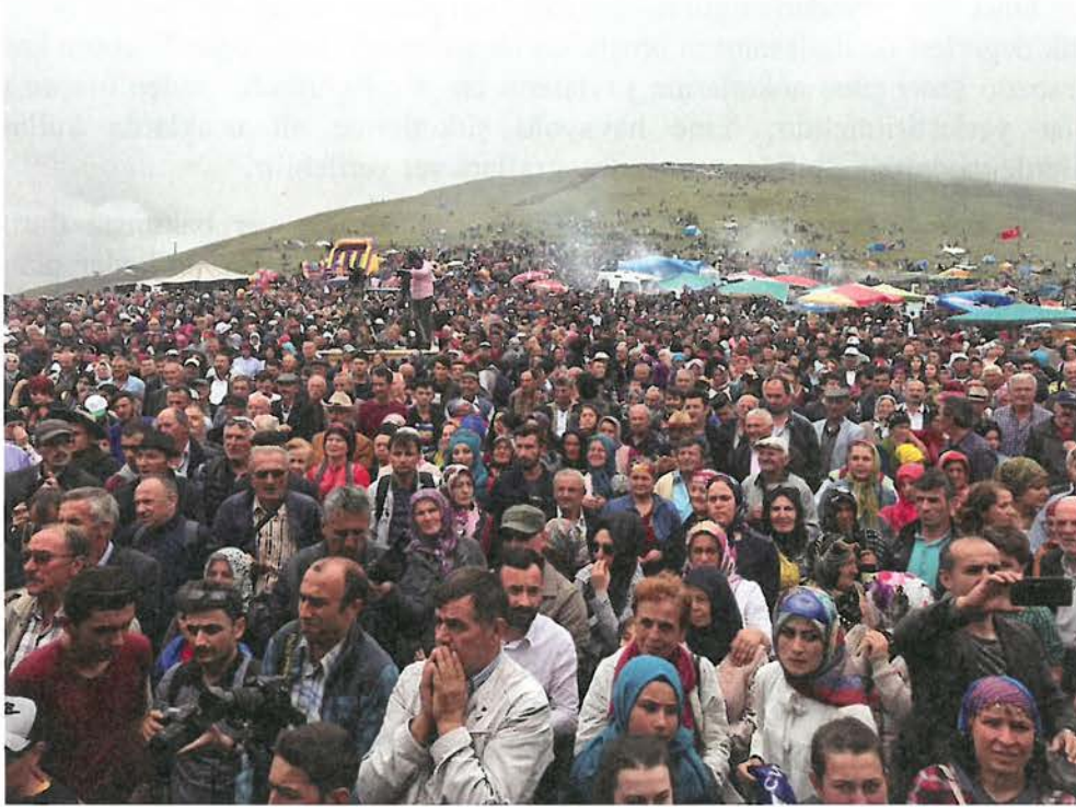
Foto 6. Kadirga Yaylası'nda her yıl temmuz ayının 3. haftasının Cuma günleri düzenlenen yayla şenliğine çoğunluğu yayladan ve yakın çevreden olmak üzere çok sayıda ziyaretçi iştirak etmektedir.