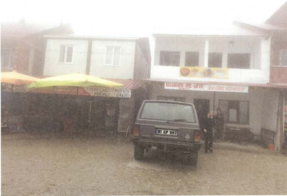
Foto 3. Erikbeli Yaylası'nda yaylacıların ve ziyaretçilerin çeşitli ihtiyaçlarını karşılamaya yönelik lokanta, manav ve market gibi ticari birimler bulunmaktadır.

Yaylaların ticari fonksiyonunu güçlendiren bir diğer husus ise haftanın belli günlerinde kurulan pazarlardır. Nitekim yaz devresinde Kadirga ve Güvende yaylalarında Cuma günleri, Kazıkbeli Yaylası'nda ise Çarşamba günleri pazar kurulmaktadır. Bu pazarlarda daha çok balta, orak, kürek gibi günlük işlerde kullanılan çeşitli aletler; yular, hayvan çan ve zili gibi hayvanlar için alınan kullanım malzemeleri; yatak ve yorgan gibi yaylacı ihtiyaçları; Araköy ve Gümüşhane köy ekmekleri; çeşitli sebze ve meyveler; züccaciye ürünleri; sofrasahane, yoğurt kabı, yayık gibi ahşap ürünler; çeşitli tuhafiyeye ürünleri ile pestil-köme, dut pekmezi gibi yerel ürünler... satılmaktadır (Foto 5).