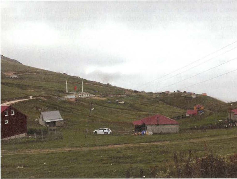
Foto 1. Kadırga Yaylası da Kürtün ilçesindeki yaylaların çoğu gibi yüksek aşınım düzlükleri üzerinde yer almaktadır.

Kürtün ilçesindeki yaylalardan Anadolu genelinde olduğu gibi yüzyıllar boyunca hayvancılık amaçlı yararlanılırken, 1980'lerden itibaren fonksiyonel bir değişim yaşanmaya başlanmıştır. Nitekim yöre yaylacılarının ifadesi ile Kürtün ilçesi yaylalarından 1980'lere kadar "malcılar" yararlanırken, 1980'lerden sonra kadırga, Kazıkbeli, Güvende ve Erikbeli gibi yaylalardan "keyifçiler" de faydalanmaya başlamıştır. O halde inceleme alanı yaylalarında 1980'lere kadar hayvancılık amaçlı geleneksel yaylacılık faaliyeti gerçekleşmişken, söz konusu dönemden itibaren rekreasyonel yaylacılık yaygınlaşmaya başlamıştır (Foto 2).