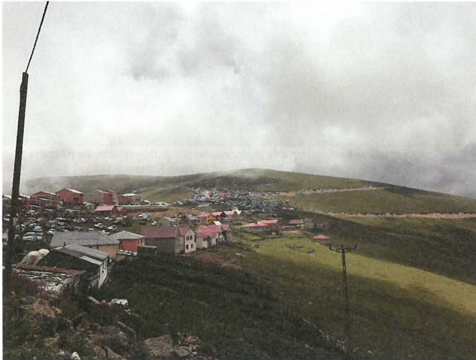
Foto 2. İnceleme alanında turizm potansiyeli yüksek olan yaylalardan biri olan Güvende Yaylası'nda rekreasyonel amaçlı yaylacıların 1980'lerden sonra artması mesken tiplerine de yansımıştır. Nitekim geleneksel meskenlerin yerini daha yeni dönemde yapılan meskenler almaya başlamıştır.

Araştırma sahasındaki yaylalarda gerek yaylacıların gerekse de turistik amaçlarla yaylaları ziyaret edenlerin çeşitli ihtiyaçlarını karşılayacak çok sayıda tesis